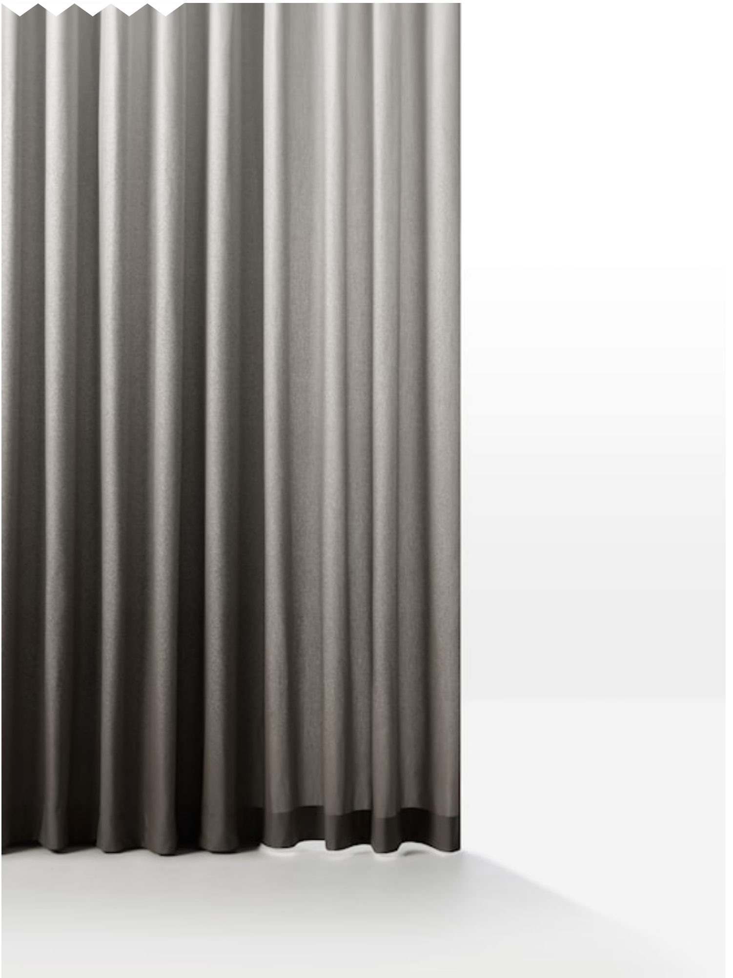
OMBRÉ 300 Hängende Textilien